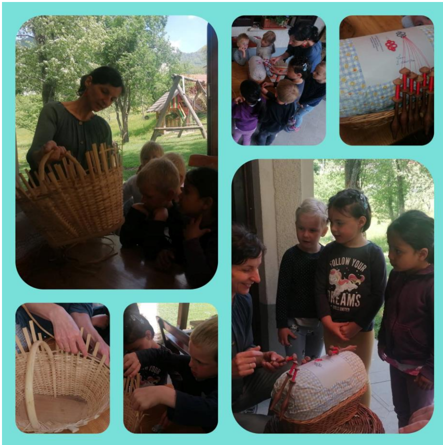
Naša slika, ki jo bomo poslali na kmetijo 😊