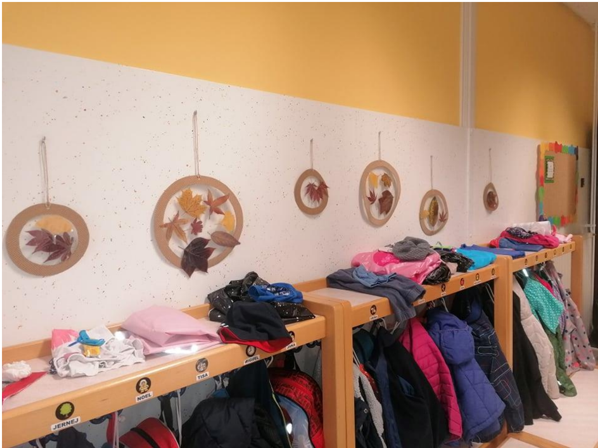
Zdaj pa različni krogi z različnimi listki krasijo našo garderobo.